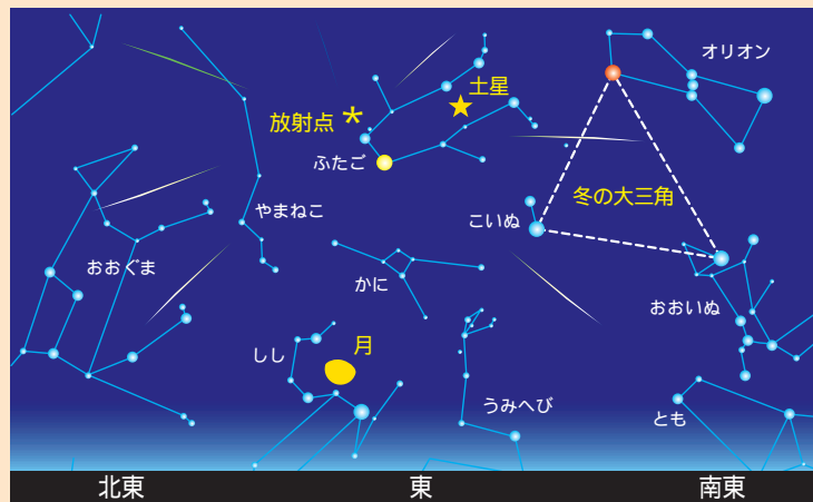
【ふたご座流星群の見え方(12月14日午後11時ごろ)】

ふたご座流星群では、ふたご座から四方八方へ流星が飛びだすように見えます。観察に特別な機材は必要なく、寝転ぶなど楽な姿勢で、空の広い範囲を眺めていけば十分です。夜の冷え込みが厳しい時期なので、くれぐれ防寒対策はしっかりとしてくださいね。