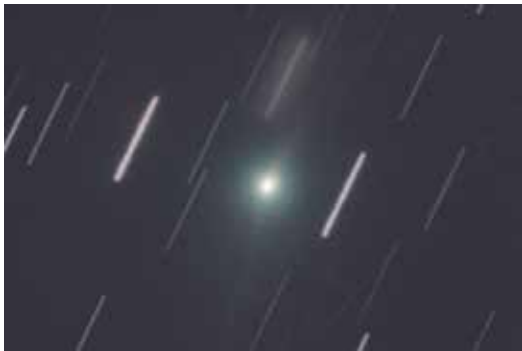
史上3つ目のインターステラ天体 3I/アトラス彗星

彗星は太陽系が生まれた時に誕生した氷の天体で、ほぼすべて、太陽系の果てと呼ばれる距離より遠く離れることはありません。しかし最近、もっと遠い場所からやってくる、例外的な彗星が見つかり始めたのです。「太陽以外のどこかの星からやってきた天体」という意味で、インターステラ天体と呼ばれています。