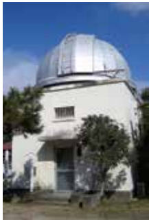
倉敷天文台・記念館