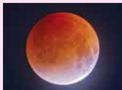
2025年9月8日の皆既月食