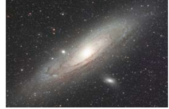
アンドロメダ銀河 (M31)

アンドロメダ銀河は渦巻き型をした約2千億個の星々の大集団です。われわれの銀河系から230万光年かなたにあるお隣の銀河で、銀河系もこれとよく似た姿であると考えられています。アンドロメダ銀河は星がよく見える場所では肉眼でも小さくかすかに確認できます。中面の星図を手がかりにアンドロメダ座周辺をさがしてみましよう。