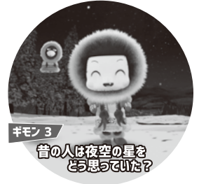
ギモン3 昔の人は夜空の星をどう思っていた？

チョコちゃん(声): 木村 祐一 制作: NHKエンタープライズ 語り: 森田 美由紀 共同テレビジョン 監修: 縣 秀彦(国立天文台) 製作・配給: 五藤光学研究所 GOTO image works