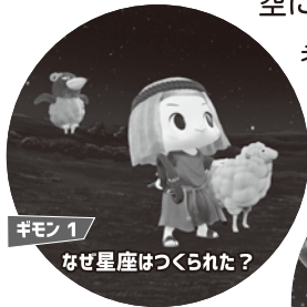
ギモン1 なぜ星座はつくられた？

チョコちゃんがまたまたプラネタリウムに登場です。今回はチョコちゃんキョエちゃんがあんな時代やこんな時代にタイムトラベル！星空にまつわる素朴なギモンをなげかけます！何も考えないでほほと夜空を見上げていると、チョコちゃんに叱られますよ！