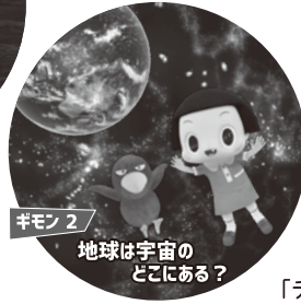
ギモン2 地球は宇宙のどこにある？