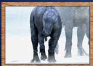
厳しい自然を乗り越えていく