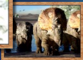
様々な恐竜達が登場