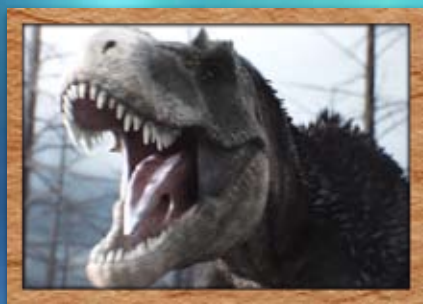
凶暴な動物が待ちかまえている