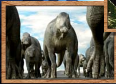
恐竜たちを迫力ある最新CGで表現