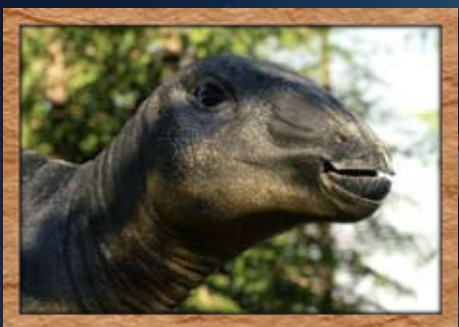
エドモントサウルスの子恐竜 スカーが大移動に初挑戦する