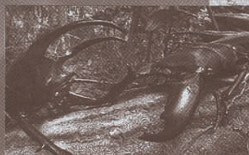
←アトラスオオカブト vs マレーヒラタクワガタ