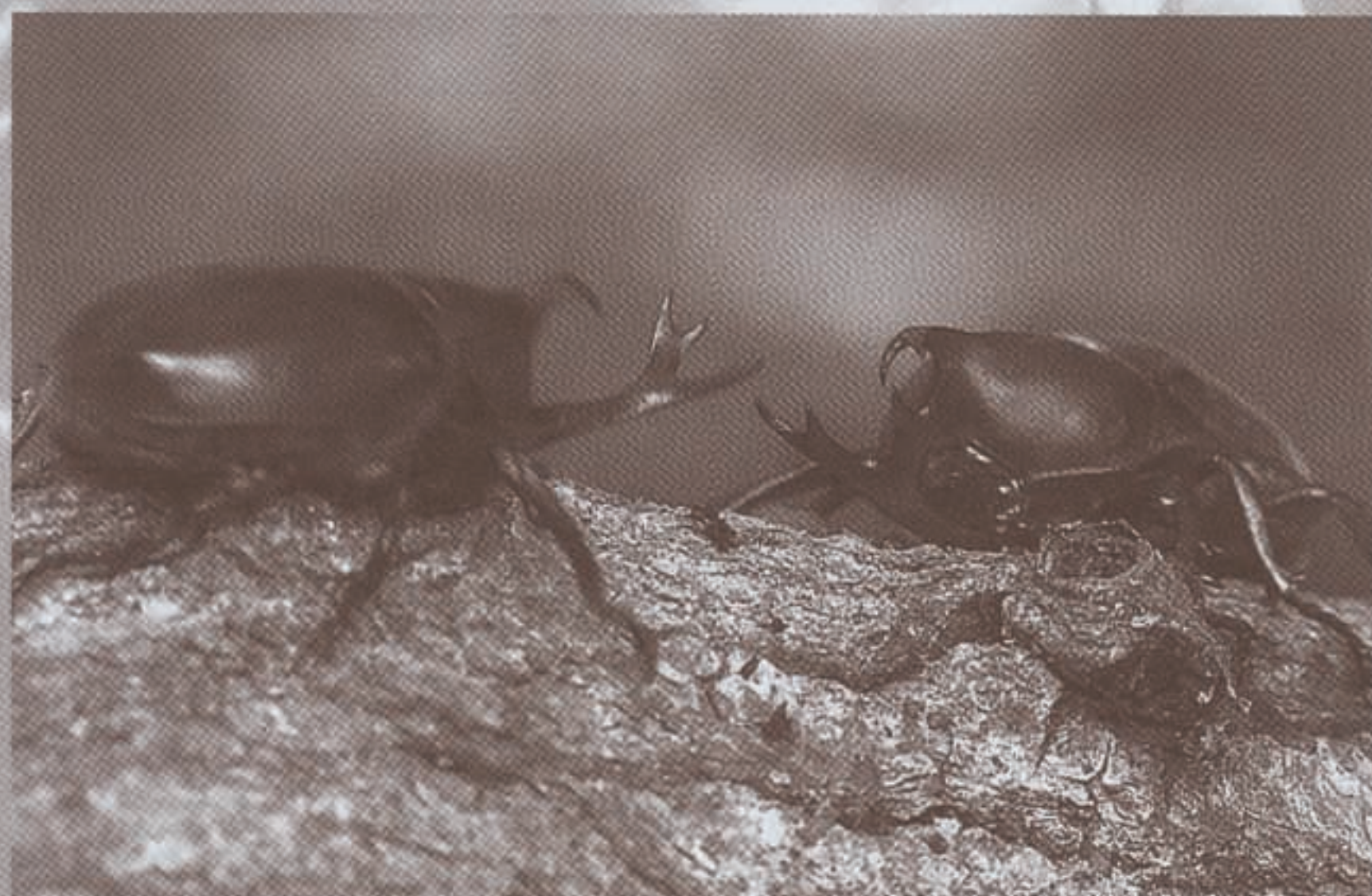
カブトムシ vs ノコギリクワガタ。はたして樹液にありつけるのは……?

昆虫は地球上でいちばん種類が多い生き物。 でも、どのくらいの数かは誰にもわからないんだ。 まだ見つかっていない虫もたくさんあるらしい。 さあ、みんなで虫たちの王国に出かけよう! みんなが大好きなカブトムシやクワガタムシはもちろん、 面白い色や形をした虫たちがたくさん棲んでいるぞ。 一番強い昆虫はどれかな? 虫たちはどんな暮らしをしているのかな? ワクワクドキドキの探検が始まるぞ!