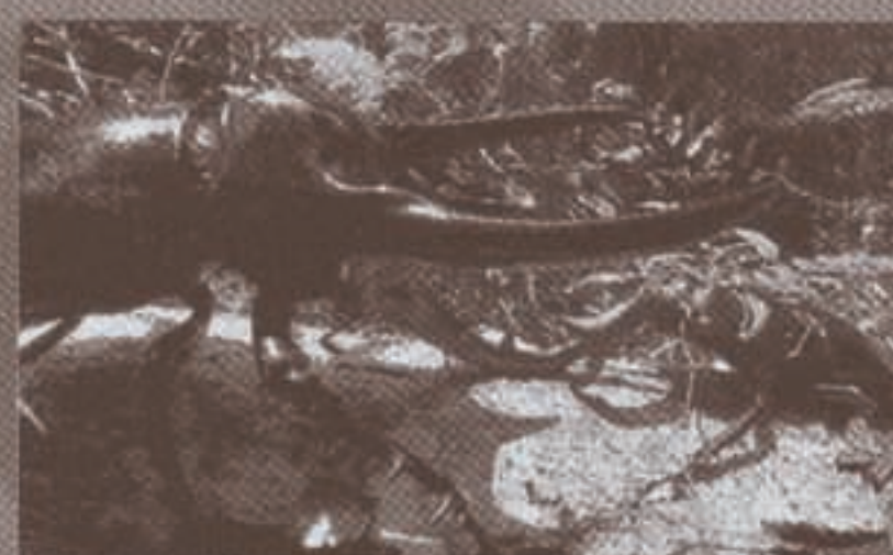
←コーカサスオオカブト vs セアカフタマタクワガタ

これは見逃せない! 世界最大級のカブト&クワガタの対決だ! 最強の甲虫はどれだ!?